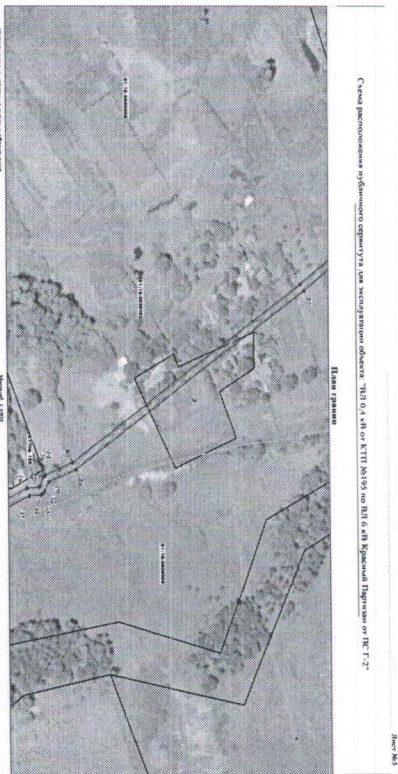
Схема расположения публично-сервитута для эксплуатации объекта "№195 кв от КТП №195 по ВЛ 6 кв Красный Партизан от ПС Г-2"